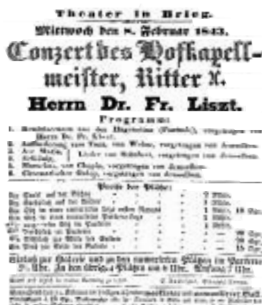
Afisz koncertu F. Liszta w Brzegu 8 lutego 1843 r. A poster of F. Liszt concert in Brzeg on 8th Feb. 1843