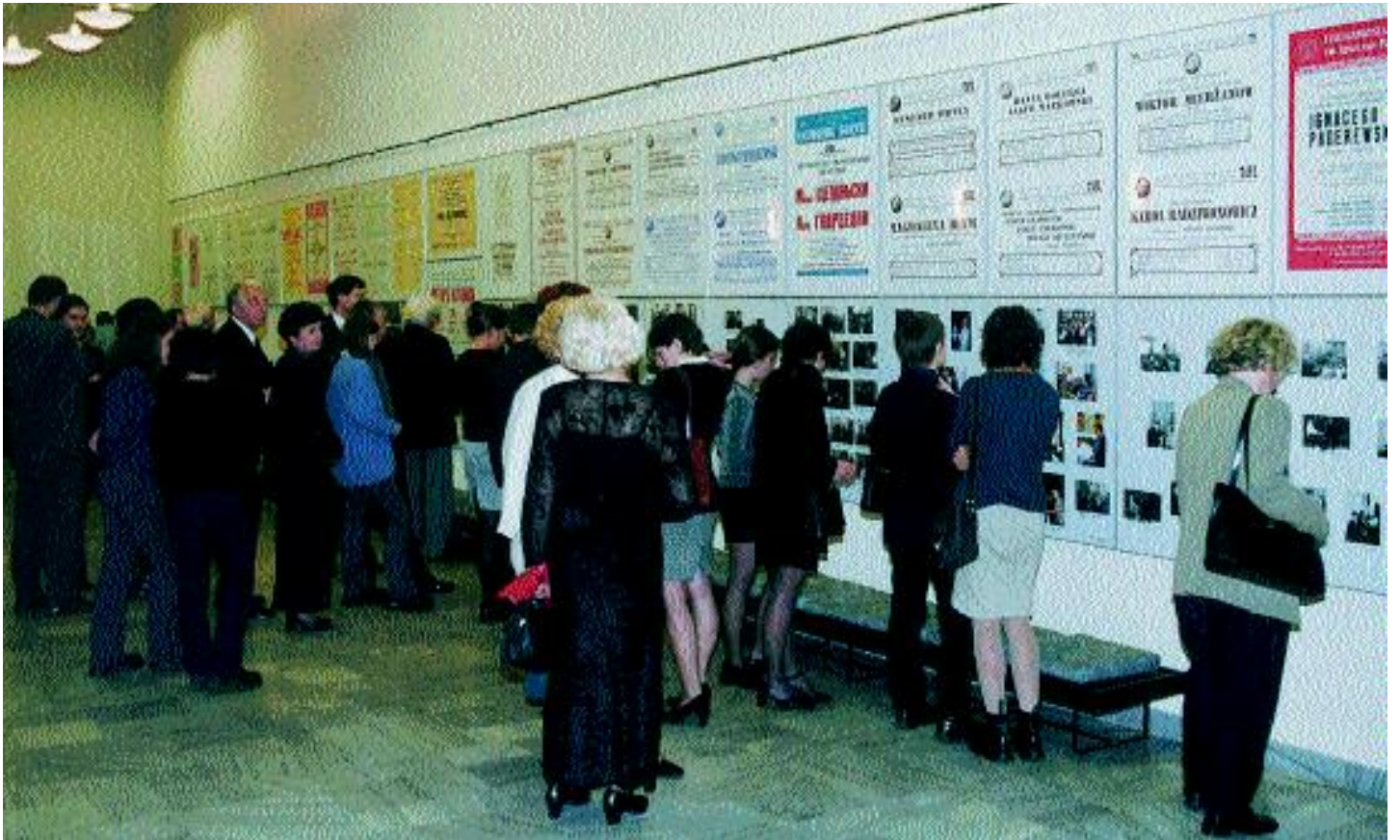
Przeglądaniem i koncertom Konkursu towarzyszyła wystawa poświęcona X-leciu działalności TiFL prezentowana w foyer Filharmonii. The exhibition about the ten years' activity of the F. Liszt Society, placed in the Philharmonic foyer.