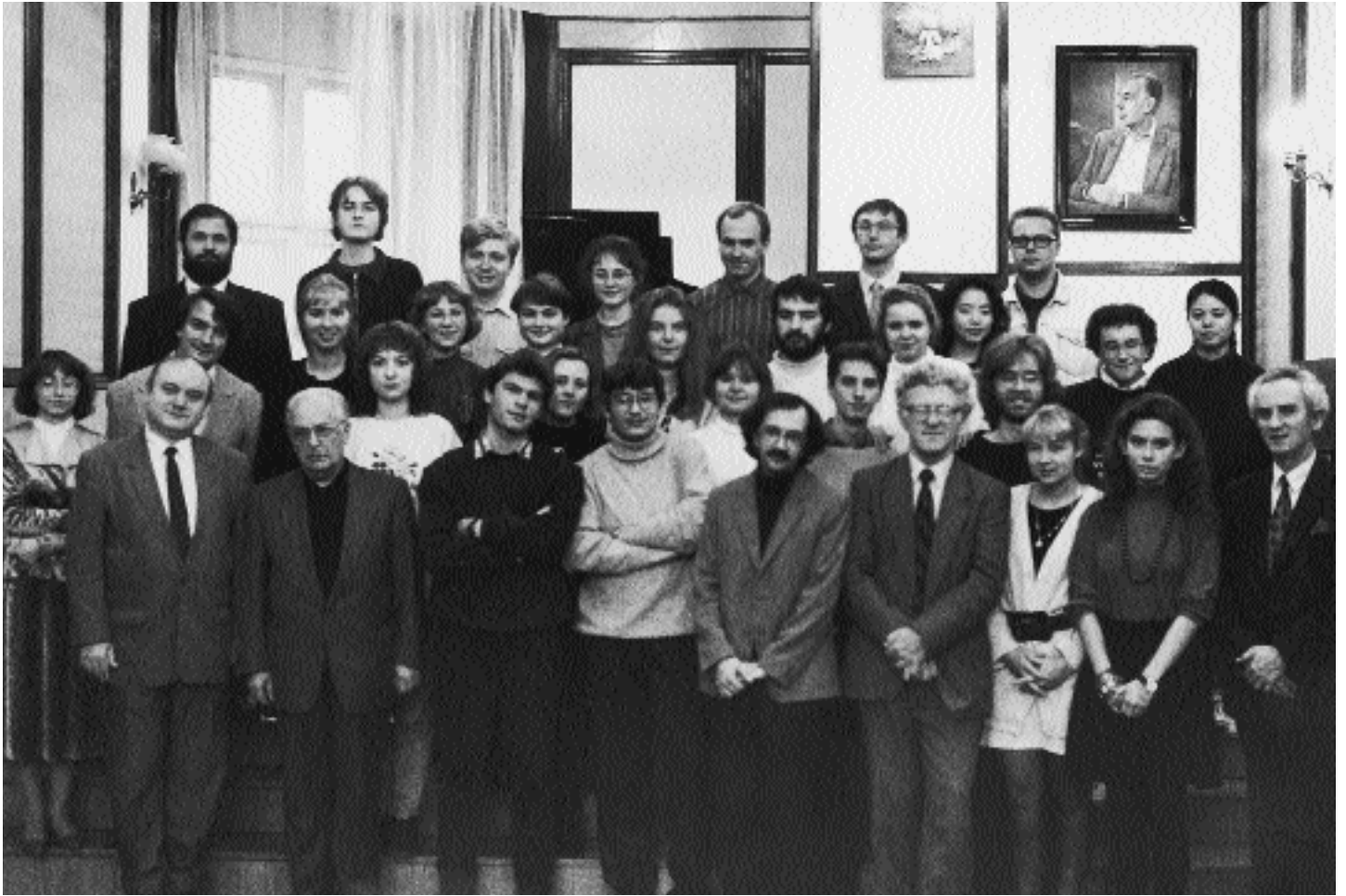
Profesorowie i uczestnicy I Kursu we wrześniu 1993 r. / The Professors and Participants of the 1st Course in September 1993.