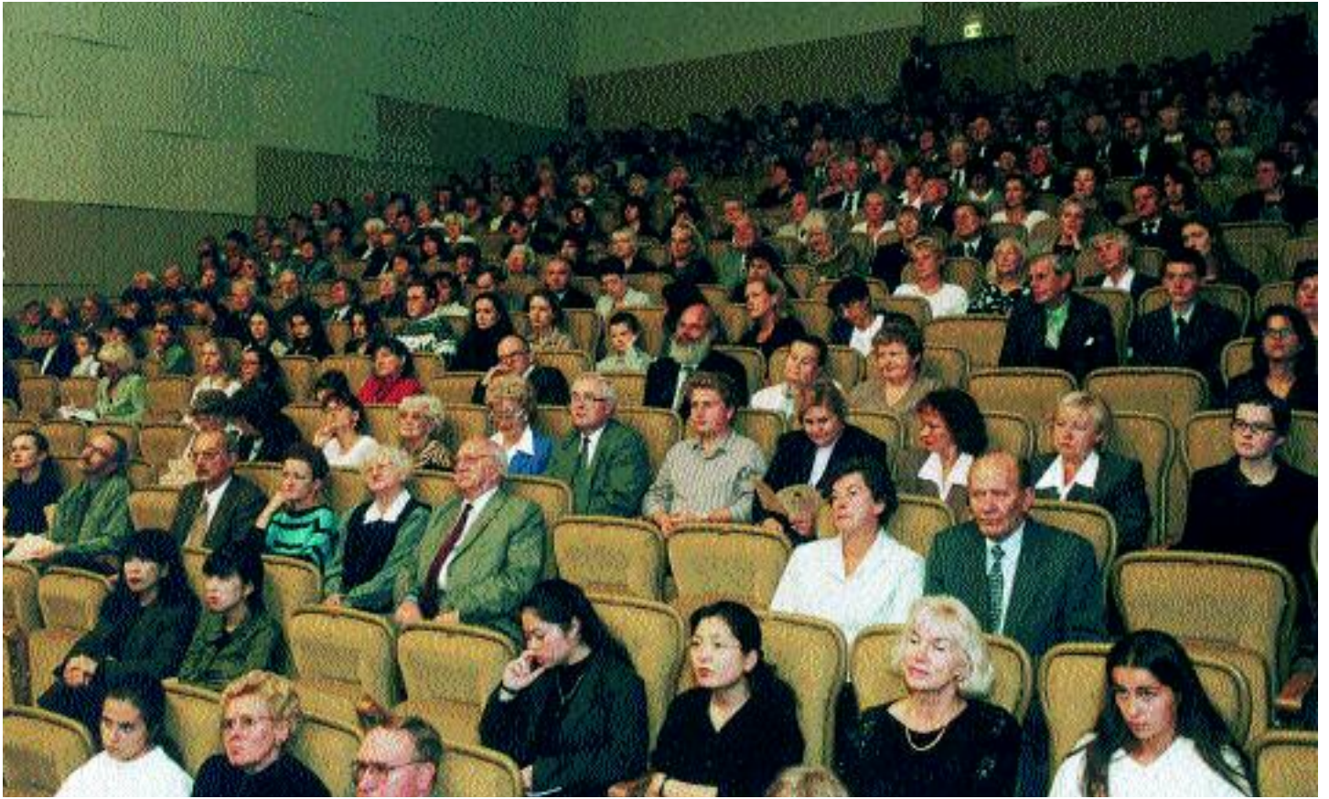
Stuchacze finału Konkursu. Audience of the finals.